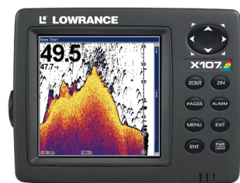
X107 C DF

Serie X (Lowrance) Distribuidor: VideoAcustic